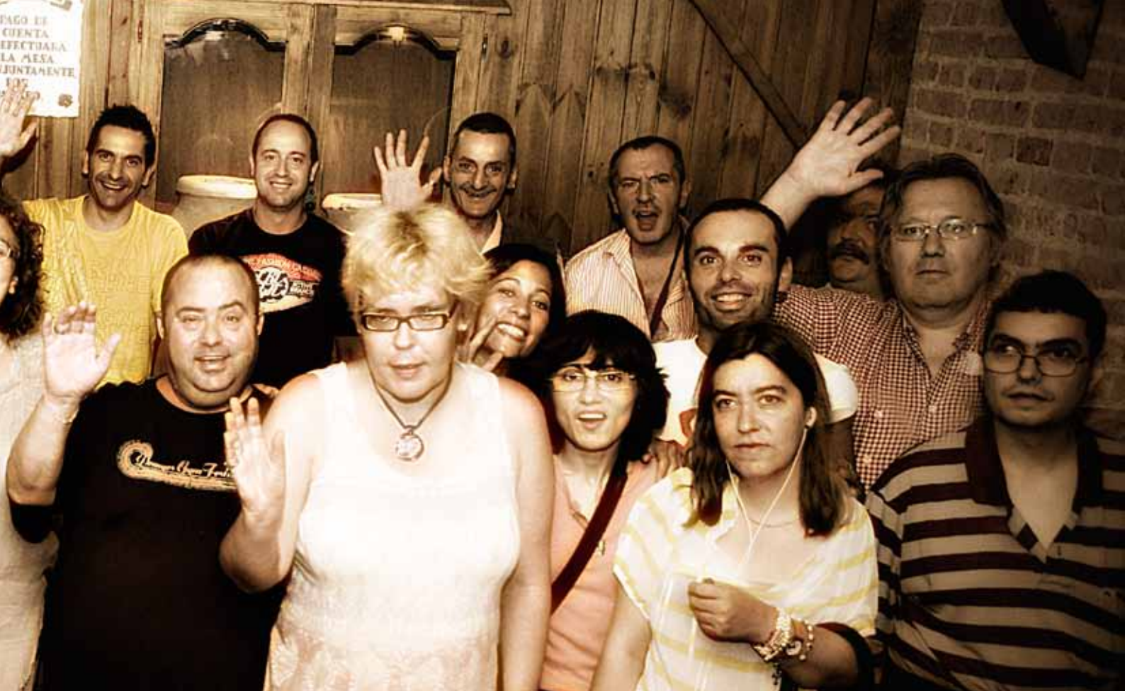
Tutelados y profesionales de la Fundación en una salida - comida.

largo, que pretende fomentar la autonomía del usuario y no tiene ningún coste para él. Este “banco de pacientes” funciona en el área de Salud Mental del Parc Sanitari Sant Joan de Déu de Sant Boi de Llobregat (Barcelona), en el Centre Assistencial Sant Joan de Déu de Almacelles (Lleida) y en Sant Joan de Déu-Serveis Sociosanitaris de Esplugues (Barcelona).